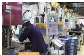
縦型成形ライン Vertical-molding line