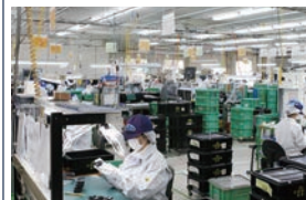
目視検査 Visual inspection