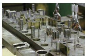
金型製造 Metallic mold manufacture