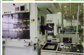
自動プレスライン Automatic press line