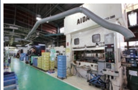
大型プレス Large press