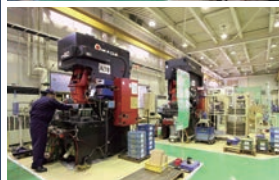
プレスライン Press line