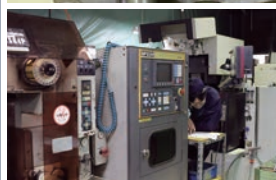
各種加工機 Various processors