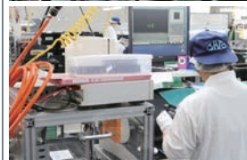
導通検査 Continuity check