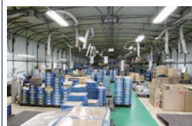
保管庫 Storage warehouse