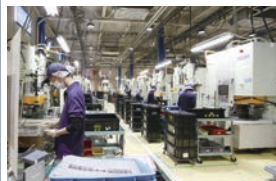
縦型成形ライン Vertical-molding line