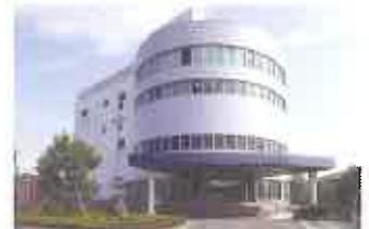
新富士工場 Shin-Fuji Factory