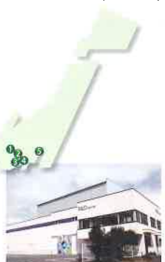
R & D センター R&D Center