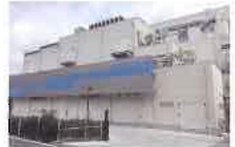
本社工場 Headquarters Factory