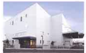
新富士第二工場 Shin-Fuji Second Factory